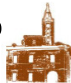
BIBLIOTECA COMUNALE CORRIDONIA

CORRIDONIA_Palazzo PERSICHETTI Piazza del Popolo DOMENICA 03 luglio 2011 ore 10,30